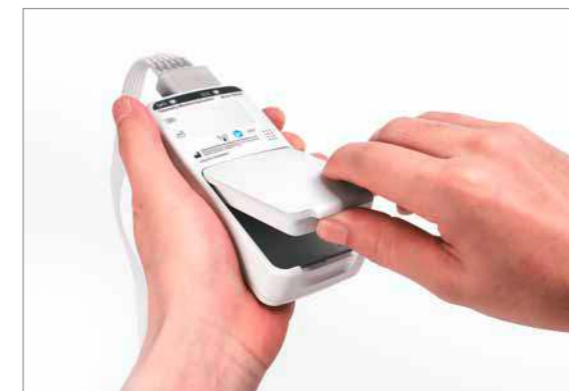
Austausch des Akkus in nur einem Schritt

Verwendung auf lange Sicht deutlich günstiger ist. Um die Betriebszeit zu verlängern, kommt ein Energiesparmodus zum Einsatz, der den Bildschirm schwärzt und den BeneVision TM80 dennoch in ständiger Bereitschaft hält. Der aktuelle Ladezustand wird im komfortablen Display permanent angezeigt.